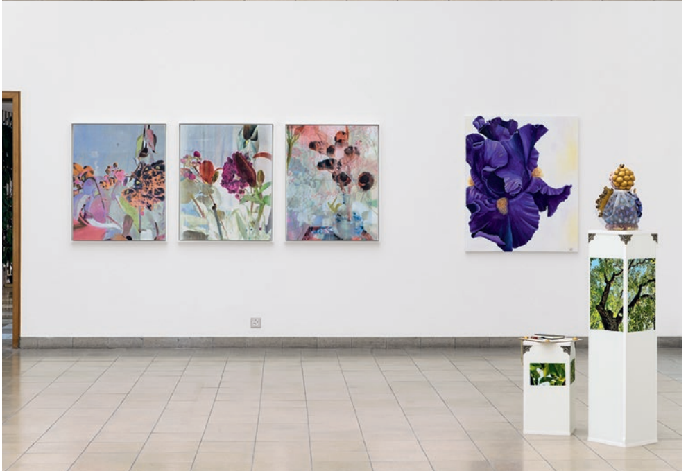
Ausstellungsansichten KUNSTSCHAFFEN GLARUS 2022 (A-L) KUNSTHAUS GLARUS, 11.12.2022–5.2.2023